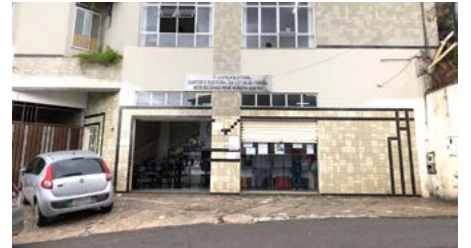
Cartório Eleitoral em Itabira

Segundo o chefe do cartório eleitoral, a prioridade será a segurança dos