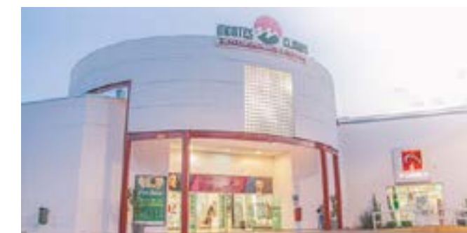
Shopping Montes Claros