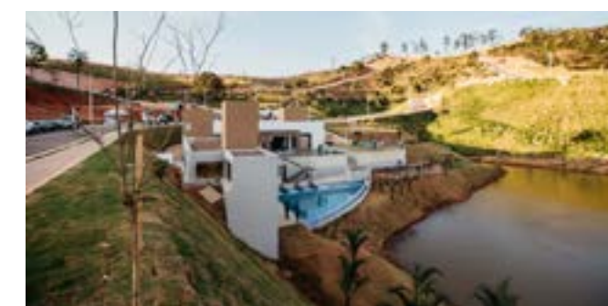
Village da Lagoa