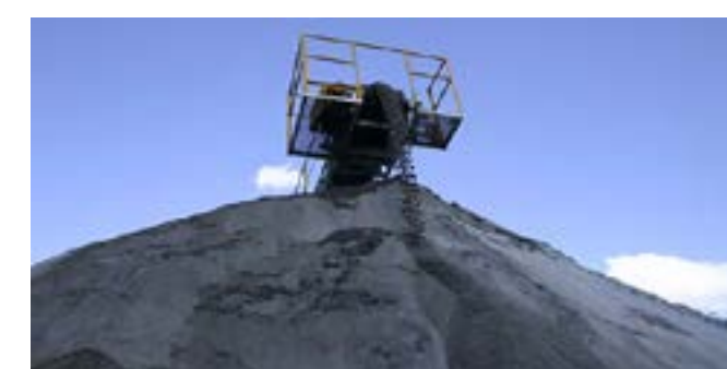
Minas de Agregados