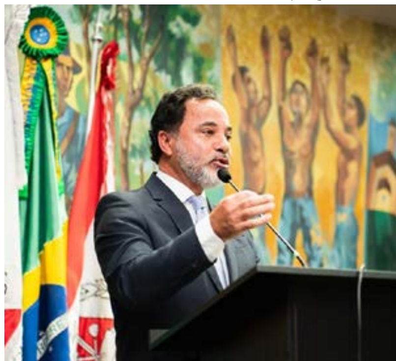
Marco Antônio Lage é prefeito de Itabira e presidente da AMIG Brasil