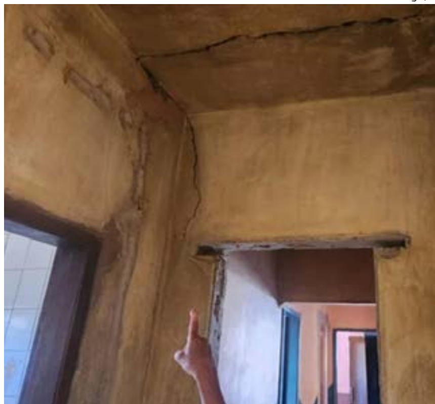
Na imagem é possível ver uma grande trinca em um dos imóveis condenados pela Defesa Civil

A medida é vista como um avanço no processo de reparação das famílias atingidas pelas obras de descomissionamento do Sistema Pontal, já que amplia a proteção das comunidades e assegura o acompanhamento da Assessoria Técnica Independente Fundação Israel Pinheiro em todas as etapas.