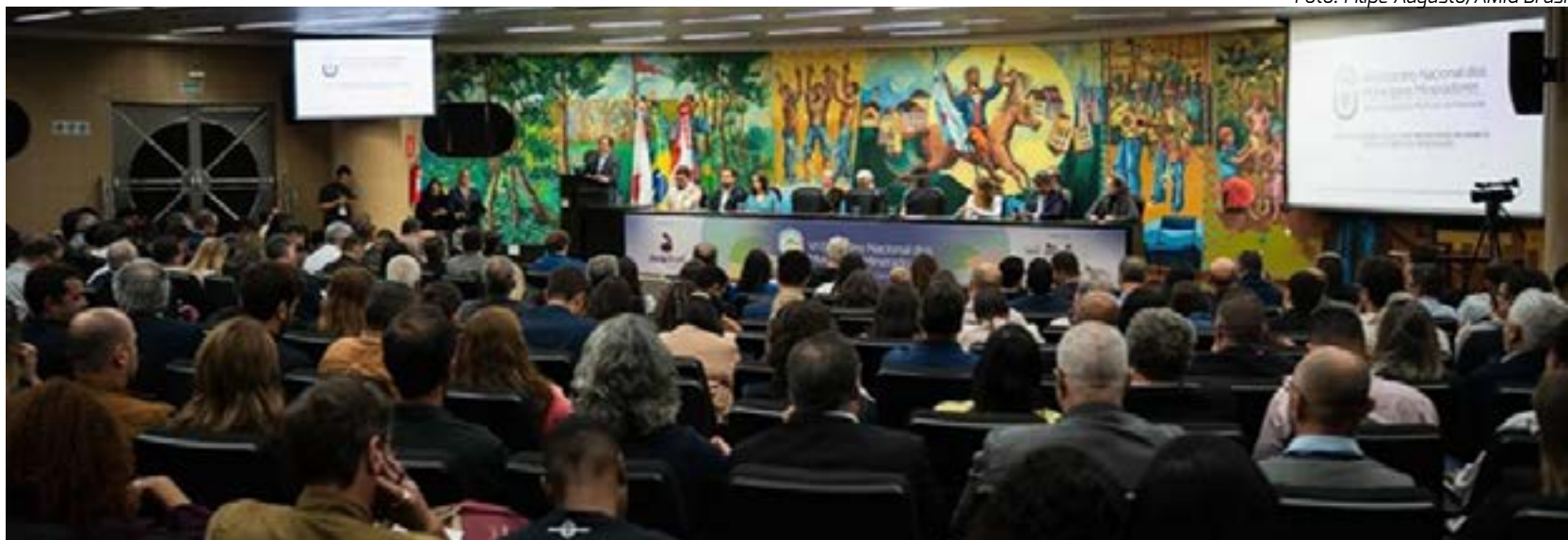
Encontro Nacional dos Municípios Mineradores aconteceu no auditório do TCE-MG, em BH