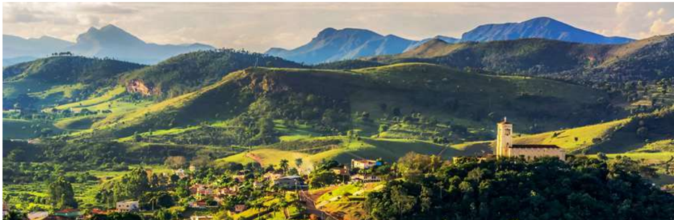
Vista Aérea de Conceição do Mato Dentro em meio ao complexo da Serra do Espinhaço.