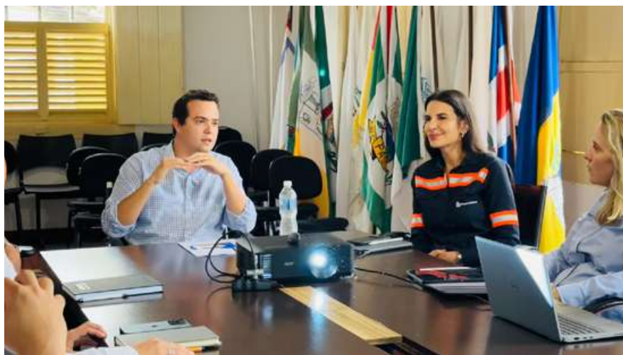
Reunião entre a Prefeitura de Conceição do Mato Dentro e representantes da Anglo American

Embora seja um protocolo de intenções, que não possui força contratual como um convênio, Otacilinho afirma que o município busca mecanismos para reforçar a cobrança. A estratégia é transformar parte das obrigações pactuadas em condicionantes nos licenciamentos ambientais estaduais. "A relação é saudável, mas com responsabilidade", garante.